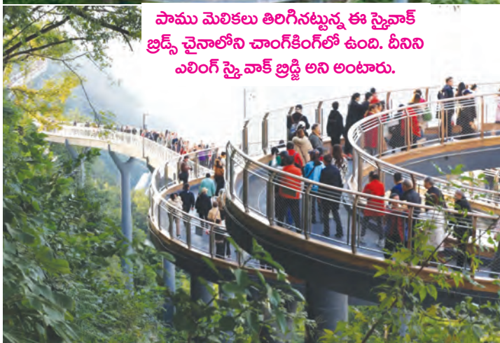
పాము మెలికలు తిరిగినట్లున్న ఈ స్కైవాక్ బ్రిడ్జ్ చైనాలోని చాంగ్కింగ్లో ఉంది. దీనిని ఎలింగ్ స్కై వాక్ బ్రిడ్జి అని అంటారు.